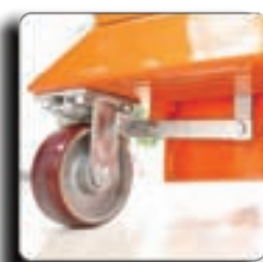
自动刹车系统-选配