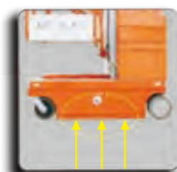
自动坑洞保护系统